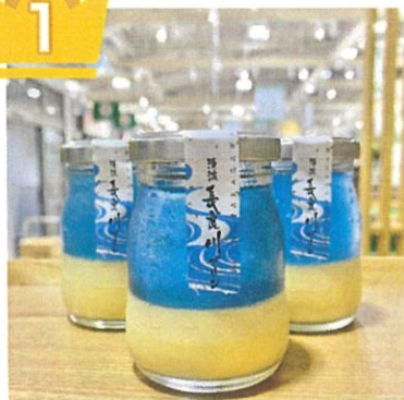
清流長良川フリン