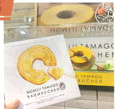
もみじたまごの バウムクーヘン