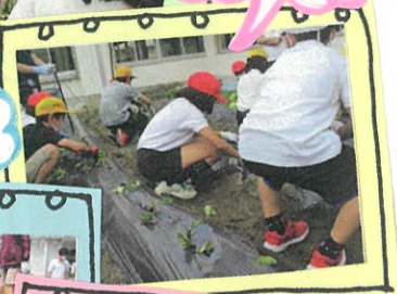
大きくなり揃いに☆