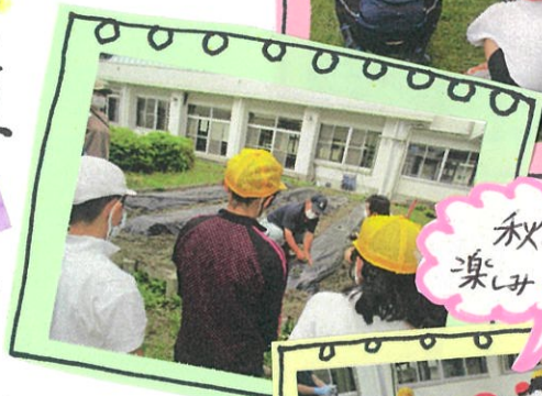
秋の収穫が楽しみ♡