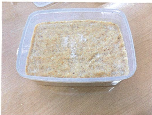
↑今回はこんな感じです

農業の応援団では、他にもプラント-栽培講習会を開催したり、お得な情報をもらえたりします! 一糸者に農業を応援しましょう 😊