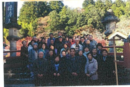
奈良 女人高野「室生寺」「長岳寺」旅行