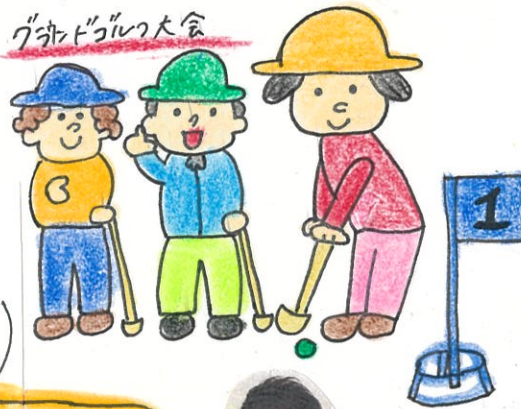
グランドゴルフ大会