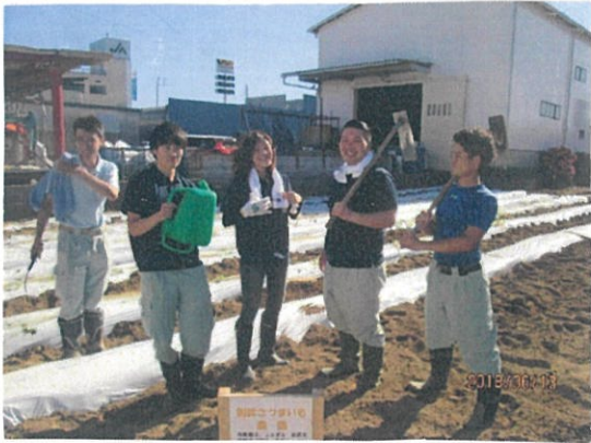
作業後のさつまいも笑顔