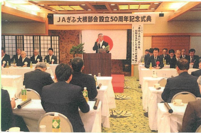
JAぎふ大根部会設立50周年記念式典

今までの歴史の振り返りと、これからの抱負を確認し合いました。 山あり谷ありの50年間たっただろうことを思うと、感慨深いものがあるなあと感じました!