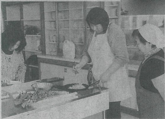
料理をする生産者

JAぎふ大根部会守口生産組合はこのほど、岐阜市のJA則武支店で「守口だいこん」を使った料理を作った。 「守口だいこん」は、県が飛騨・美濃伝統野菜に認証する珍しいダイコン。漬物業者との契約栽培で、直径約2・5センチ、長さ1センチ以上にもなる細長い形状が特徴。かす漬の「守口漬」として親しまれている。