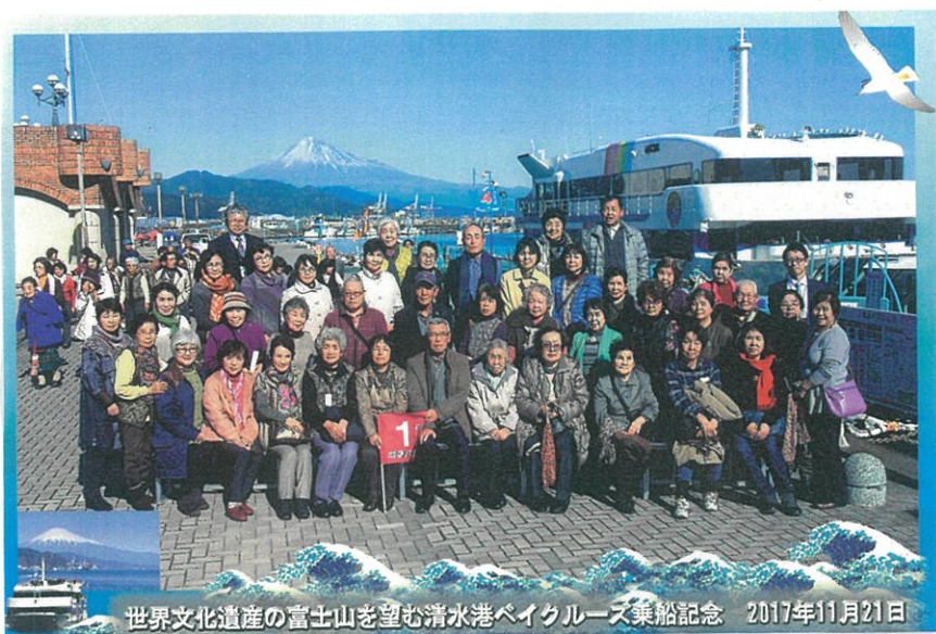
世界文化遺産の富士山を望む清水港ベイクルーズ乗船記念 2017年11月21日

12/21(火)に年金友の会 長良、長良西支部合同で 静岡に行きました。 天候にも恵まれ、乗船 した遊覧船からは雄大な 富士山を眺めることが できました!